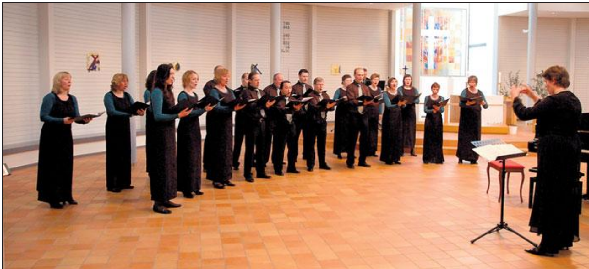
Forsterket, Con Brio teller i dag bare 17 medlemmer, men for anledningen var koret noe forsterket.

– Det er høy kvalitet over, og et stort spenn i, hans oversettelser, heter det i juryens begrunnelse. (ANB-NTB)